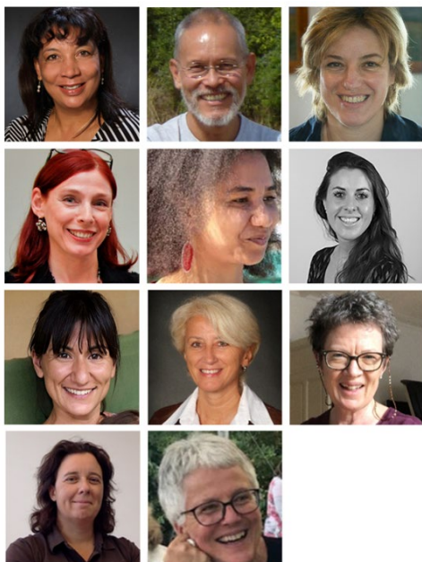
Les onze membres du Comité actuel d'Elargis tes Horizons.